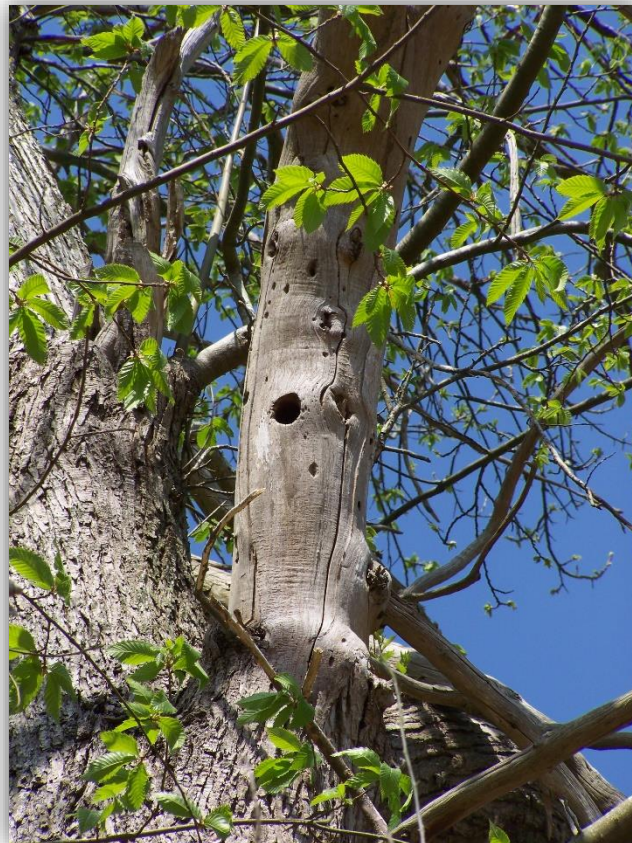
Trou de pics (Lucie DESVAUX, Avrillé-les-Ponceaux, 2019)