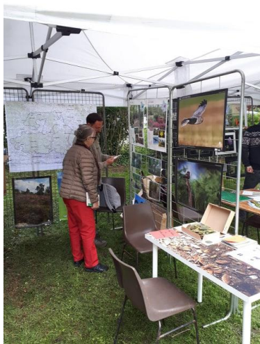
Information sur Natura 2000 à la Fête de la Nature de Bourgueil (juin 2019)