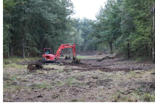
Photos : Réalisation des travaux de restauration dans la cadre du contrat Natura 2000