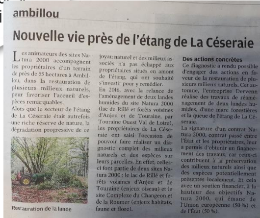
Article de presse évoquant la réalisation du contrat Natura 2000 (Nouvelle République, 13/11/19)