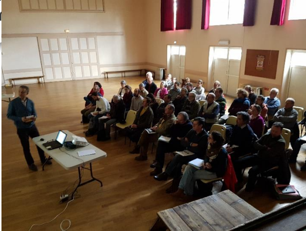
COPIL, le 17/01/2019 à Channay-sur-Lathan